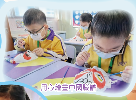
用心繪畫中國臉譜