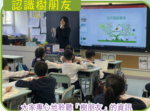
大家專心地聆聽「樹朋友」的資訊