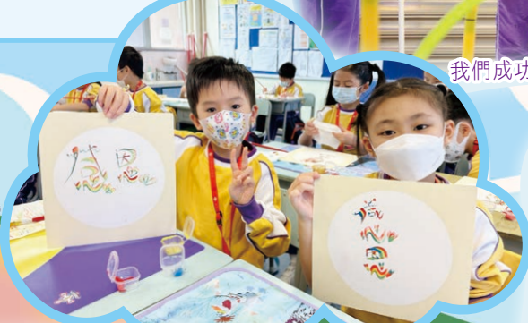
這是我們創作的「彩虹書法」，大家喜歡嗎？