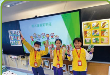
「我們是樹木護養的小專家！」