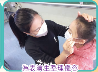
為表演生整理儀容