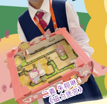
二義 朱柳琳 8 《磁力迷宮》