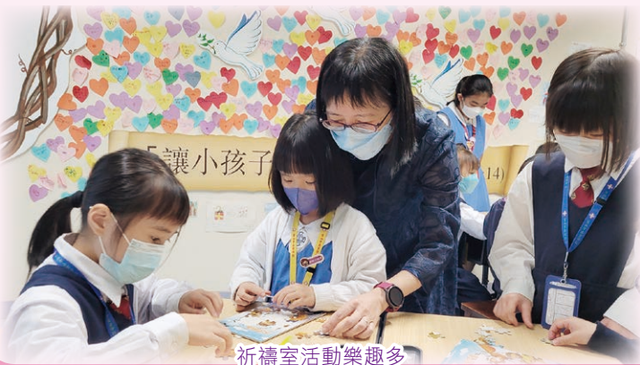
祈禱室活動樂趣多