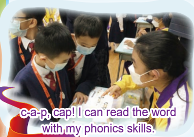
C-a-p, cap! I can read the word with my phonics skills.

Learning English is and should be fun! Ka Ling students love learning English!