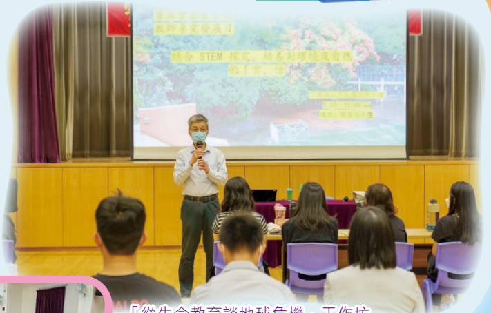
「從生命教育談地球危機」工作坊