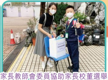
家長教師會委員協助家長校董選舉