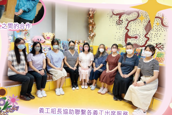
義工組長協助聯繫各義工出席服務