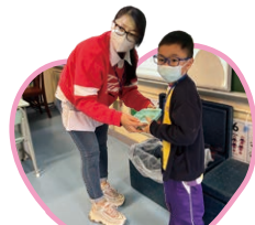
感謝家長義工 姨姨的幫忙