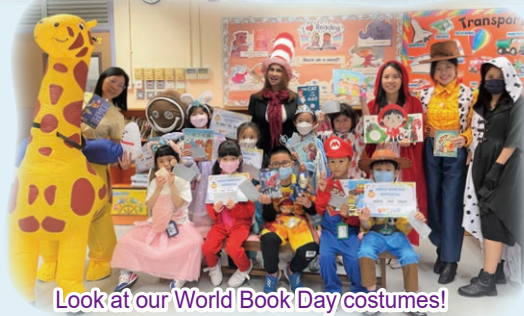
Look at our World Book Day costumes! Can you guess who we are?

In the English Centre, our students have enjoyed chatting confidently with the English Ambassadors. A lot of new toys and board games have been provided for the students. We have even installed a claw machine for students to play phonics games! Students have been welcome to read and borrow from the wide selection of English books there. In April, we all dressed up as our favourite book characters to celebrate World Book Day!