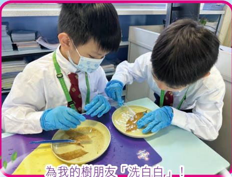
為我的樹朋友「洗白白」！