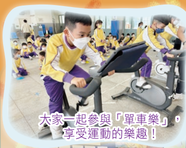
大家一起參與「單車樂」，享受運動的樂趣！