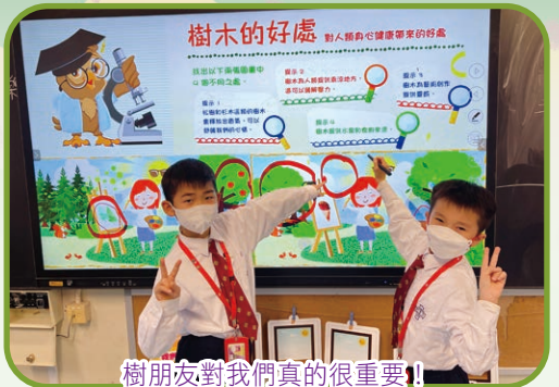
樹朋友對我們真的很重要!

本年度，本校在二年級試行以「大自然與我」為主題的單元教學，配合多元化的學習活動，如繪本教學、電影欣賞、科學探究及體驗活動等，藉此欣賞天主的創造，體驗生命的奇妙和可貴，探索與認識生命的意義，尊重與珍惜生命的價值，熱愛並發展個人獨特的生命，培養愛護大自然環境的態度，實踐並活出天人物我共融共在的和諧關係。