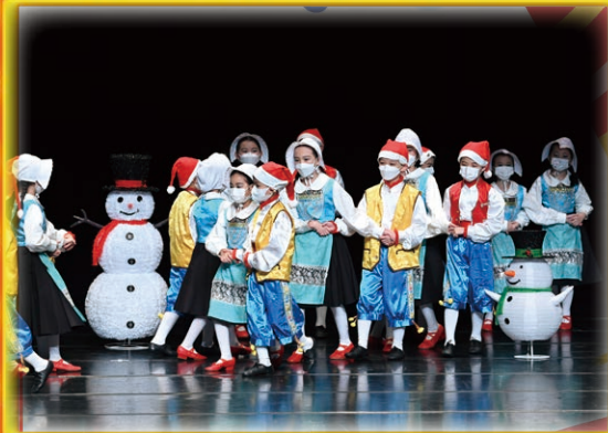
屯門第三十七屆舞蹈大賽