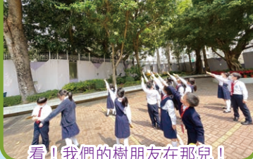
看！我們的樹朋友在那兒！