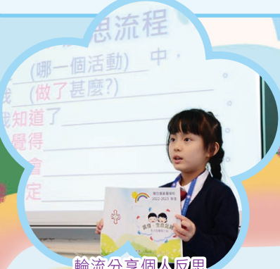
輪流分享個人反思