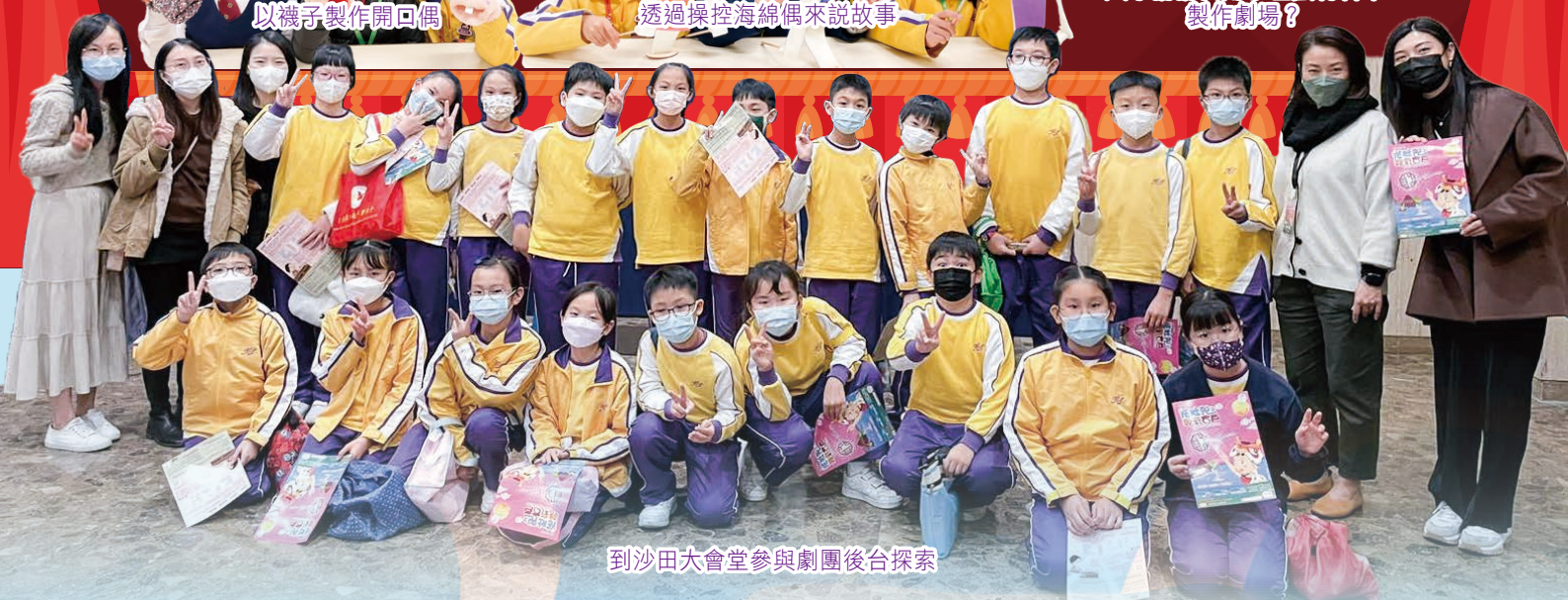
到沙田大會堂參與劇團後台探索