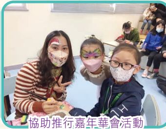
協助推行嘉年華會活動