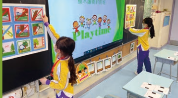
同學們全情投入地進行配對遊戲