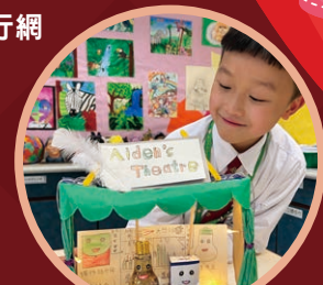
大家猜猜我用了甚麼材料來製作劇場？