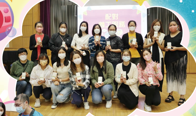
大家積極參與遊戲