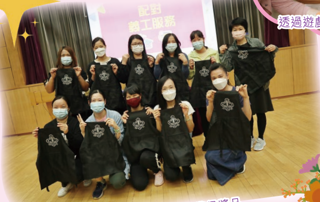
義工們在遊戲中獲得獎品