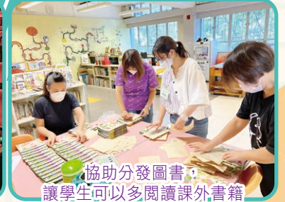
協助分發圖書，讓學生可以多閱讀課外書籍