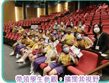
帶領學生參觀，擴闊其視野