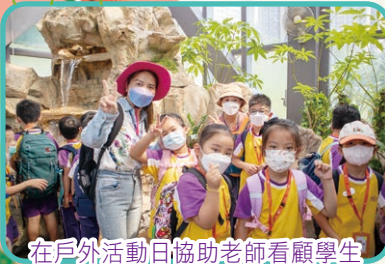
在戶外活動日協助老師看顧學生