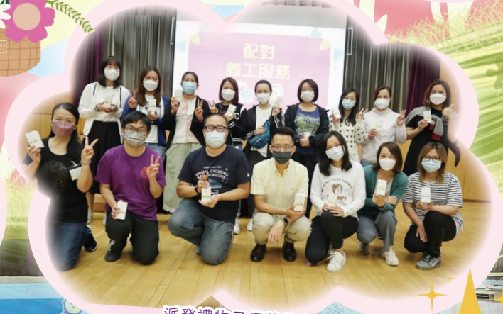
派發禮物予得獎的家長