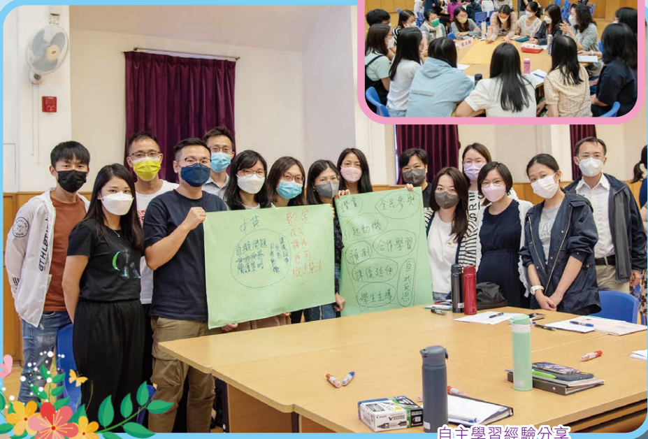
自主學習經驗分享