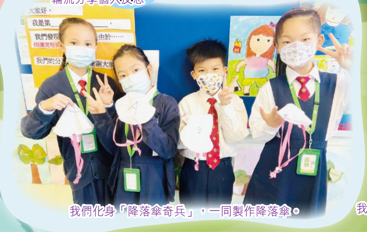
我們化身「降落傘奇兵」，一同製作降落傘。