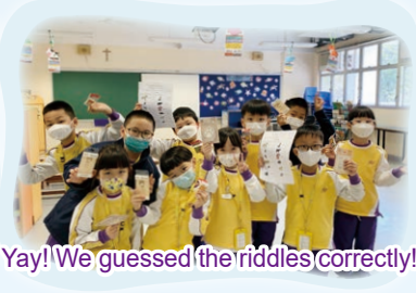
Yay! We guessed the riddles correctly!