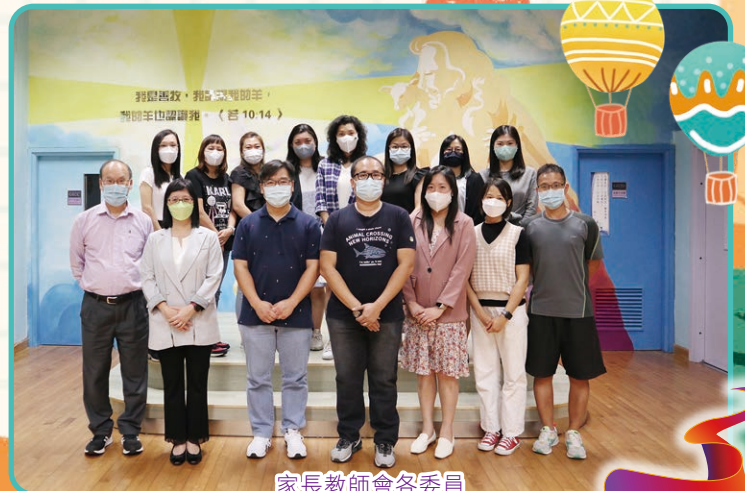
家長教師會各委員

隨着疫情漸見曙光，學校活動日漸增多，本校家長義工也積極爭取機會參與協助學校舉辦活動，如：戶外活動日、運動會、嘉年華會等。本年度共150多位家長報名成為義工。他們在百忙中抽出寶貴的時間，協助籌備及推行各項活動。在此衷心感謝家長義工們不求回報，默默付出，使各項活動得以順利舉行！