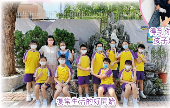
復常生活的好開始

課室添上了「新裝」：全新的課室簿櫃、課室空調設備、學生桌椅、壁報板、黑板、活動白板、觸控顯示屏等。上課時，師生能在舒適環境中感受現代化教學設備帶給我們的便利。我相信：這樣的學習環境一定可以提升學與教的效能。我感謝教職員的策畫與安排，感謝各項工程人員的技術協助與支援。我們也將會陸續優化其餘課室及特別室的設備，讓學生在先進及互動的學習環境中，展開學習的新里程。