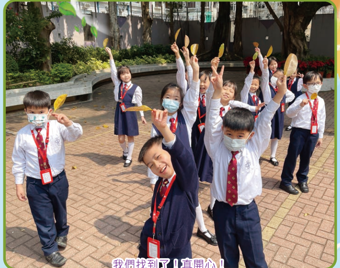
我們找到了！真開心！