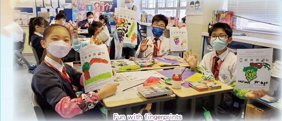
Fun with fingerprints

一年一度的全方位學習日已於3月15日至3月17日圓滿結束，是次活動以「賞惜·生命足跡」為主題。我們期望透過參與多元化的學習活動，培養學生自主學習的精神，並成為一個懂得欣賞世界，珍惜萬物的人。