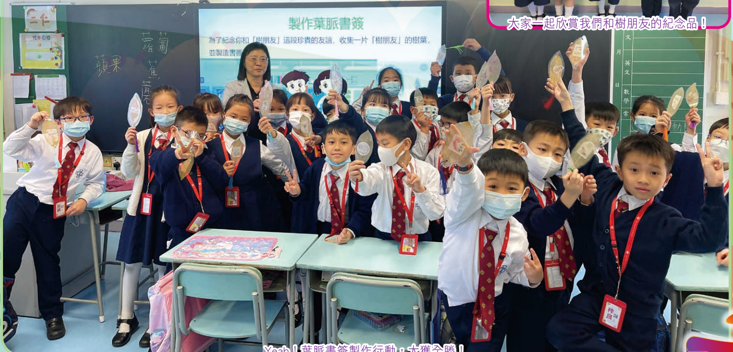
Yeah！葉脈書籤製作行動，大獲全勝！