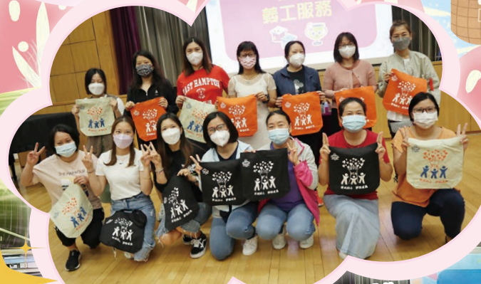
家長義工積極參與遊戲，獲頒發禮物