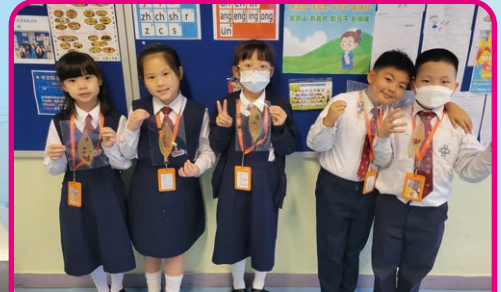
大家一起欣賞我們和樹朋友的紀念品！