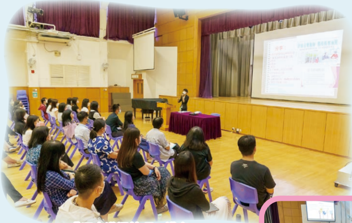
「正向溝通技巧」講座