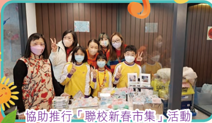
協助推行「聯校新春市集」活動