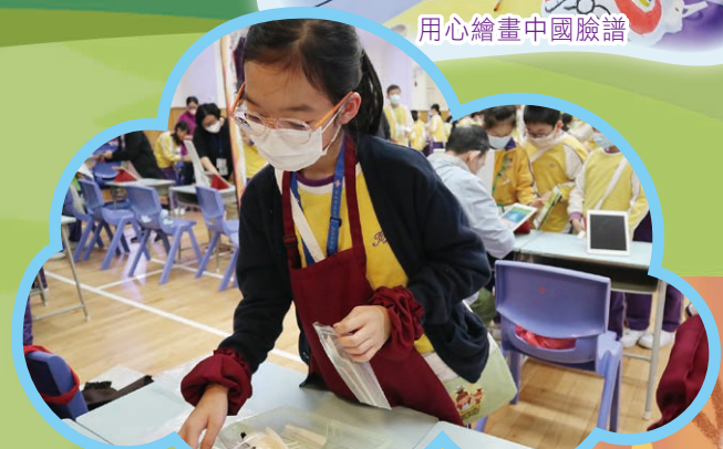
我在「e$mart理財童學會」擔任侍應，努力賺取「薪金」！