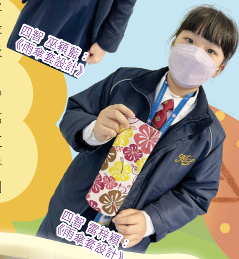
四智 雷梓穎 8 《雨傘套設計》