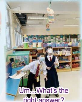
Um...What's the right answer?

There have also been thematic activities like Zodiac Riddles, a Food Expo and an Easter Egg Hunt for P.1, P.2 and P.4 students. The P.3 students played the Ka Ling Motion Sensing Games to learn grammar in an active and exciting way.