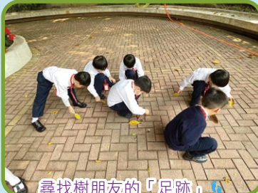
尋找樹朋友的「足跡」