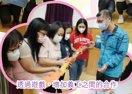
透過遊戲，增加義工之間的合作