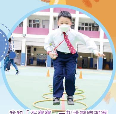
我和「蛋寶寶」一起挑戰障礙賽