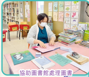
協助圖書館處理圖書