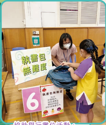
協助舉行攤位活動，讓小一生適應校園生活