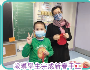
教導學生完成新春手工