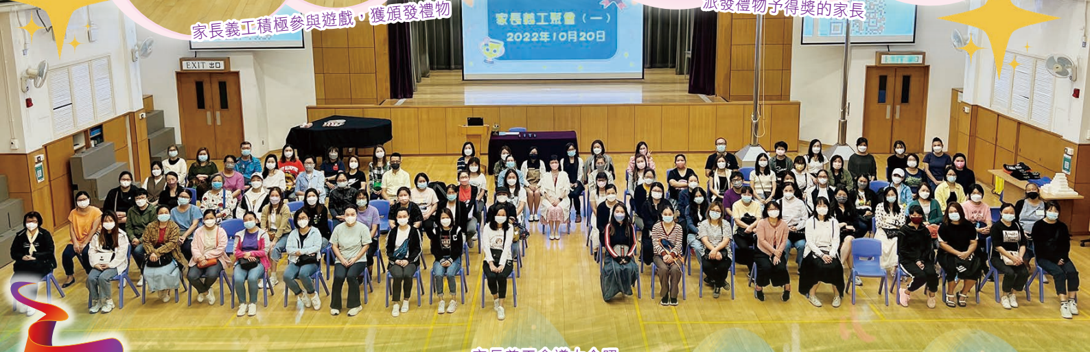
家長義工會議大合照