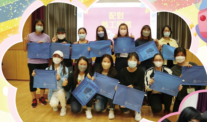
大家分享合作遊戲的成果