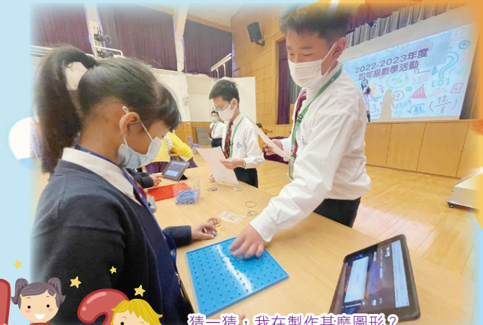
猜一猜，我在製作甚麼圖形？

本年度數學科於十二月及三月舉辦一至六年級的數學大息活動。科任老師設計多項針對學生學習難點的活動，例如：運用算柱學習位值、利用釘板製作平面圖形、透過平板電腦完成解難題目等。透過這些實物操作活動，豐富學生在課堂外的學習經歷，提高學生的學習效能，更充分體現「數感精準、解難有道、『活』化數學」的科本特色。整體學生反應非常踴躍，積極參與，成效極佳。