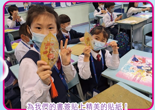
為我們的書籤貼上精美的貼紙！