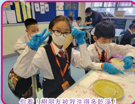
你看！樹朋友被我洗得多乾淨！