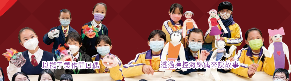
以襪子製作開口偶