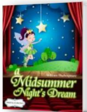
仲夏夜之夢[電子閱讀計劃]