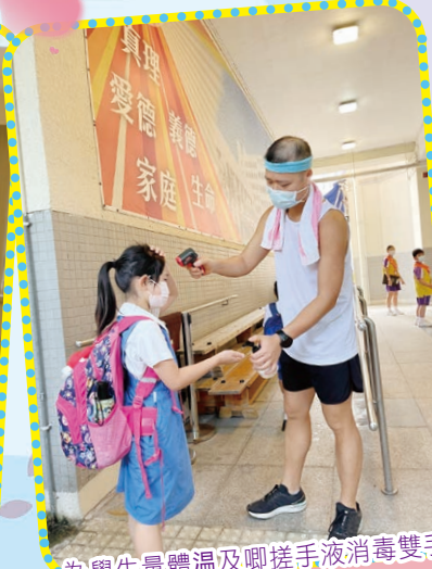
為學生量體溫及啣搓手液消毒雙手