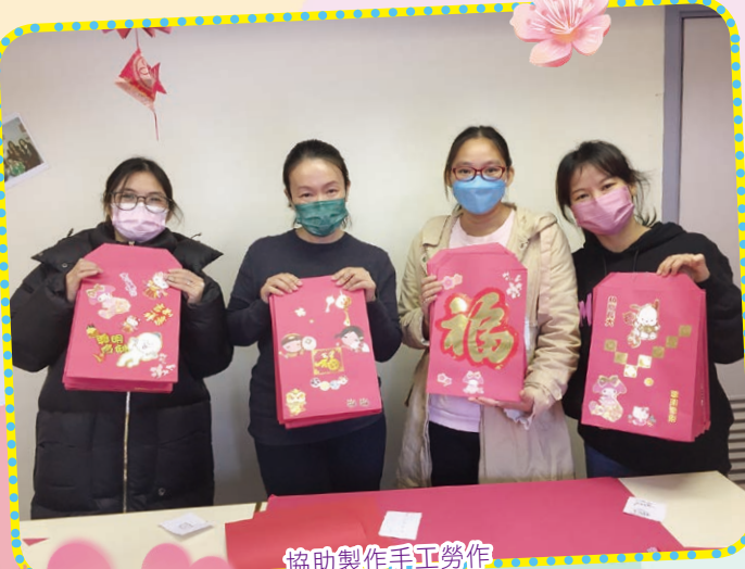
協助製作手工勞作