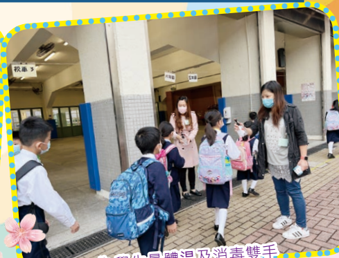
為學生量體溫及消毒雙手