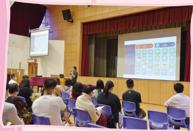
體感遊戲裝置教師工作坊

各科配合不同的課題，於課堂設計中結合體感遊戲。不同級別的學生分別於中文、英文、數學、常識、音樂及體育課中，以體感遊戲進行學習。同學間相互合作，運用溝通及協作能力，體驗從遊戲中學習的樂趣。此外，配合「愛·生命果子」獎勵計畫，於校本獎勵計畫中達標的學生，亦可獲得進行體感學習遊戲的機會，以作嘉許。