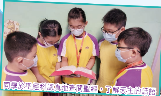
同學於聖經科認真地查閱聖經，了解天主的話語

我們深信每位學生都是一顆小種子，期望學生在濃厚的宗教氣氛培育下，於嘉靈學校這塊好土地孕育出「敬主愛人」的好學生。