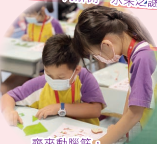
齊來動腦筋，「拼」出真的我！