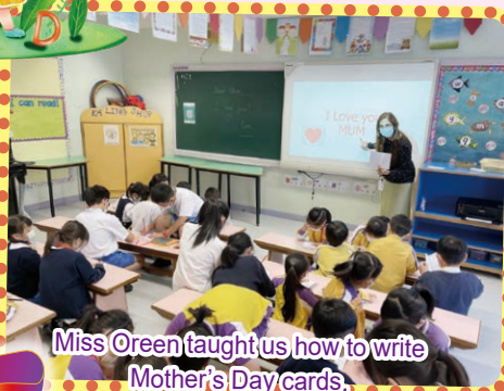
Miss Oreen taught us how to write Mother's Day cards.