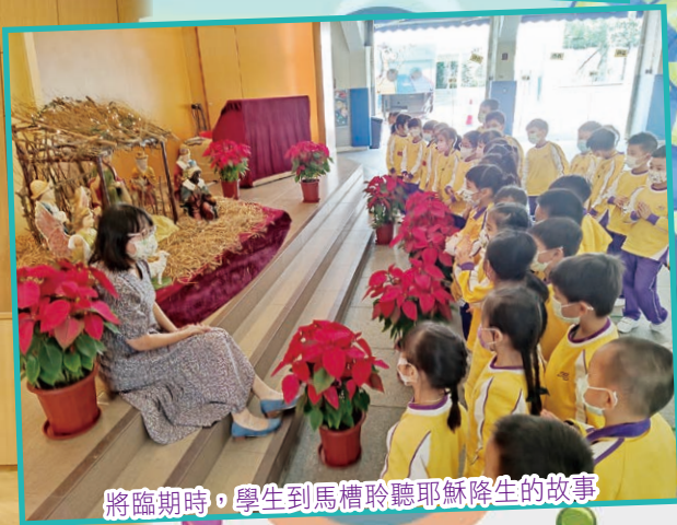
將臨期時，學生到馬槽聆聽耶穌降生的故事