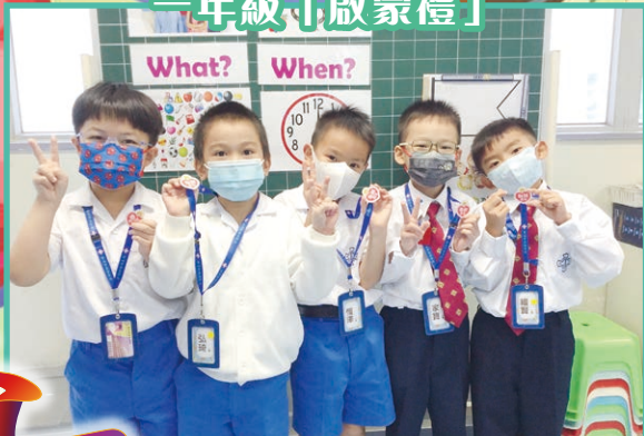
我們都收到學校送的愛心禮物，真開心！