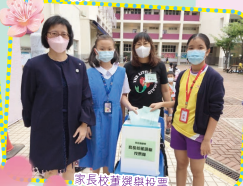
家長校董選舉投票