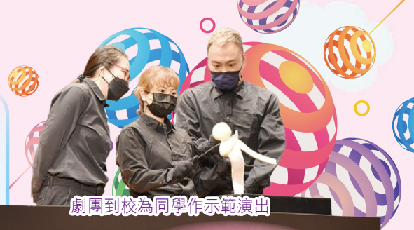
劇團到校為同學作示範演出