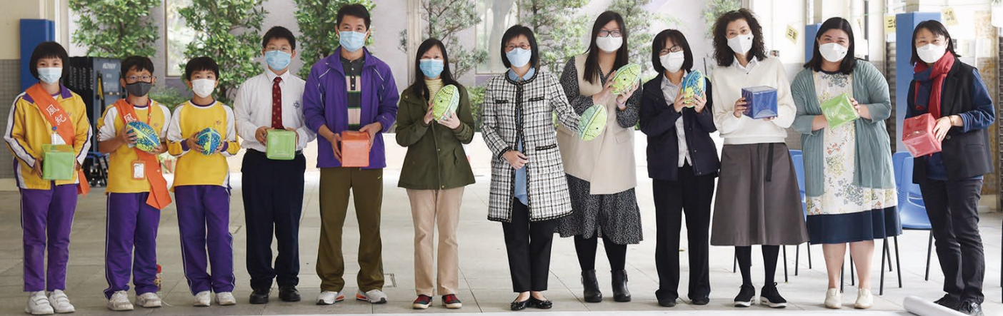
師生同樂，一起參與「嘉靈動感天地」啟動禮