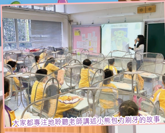
大家都專注地聆聽老師講述小熊包力刷牙的故事