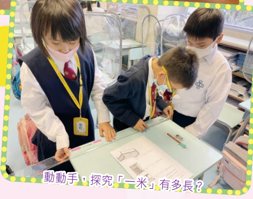
動動手，探究「一米」有多長？