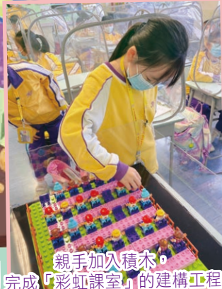
親手加入積木，完成「彩虹課室」的建構工程