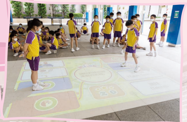
同學在互動地板上跳跳碰碰，一起享受寓學習於遊戲