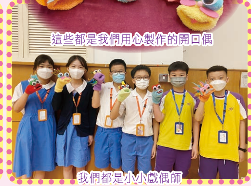
我們都是小小戲偶師