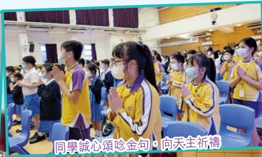
同學誠心頌唸金句，向天主祈禱