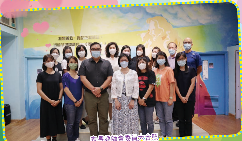
家長教師會委員大合照