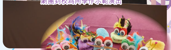
這些都是我們用心製作的開口偶