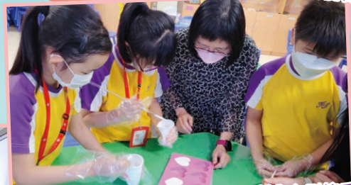
小心翼翼地將石膏液倒進模具，製作心形擴香石