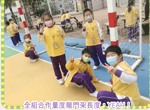
全組合作量度龍門架長度，YEAH！