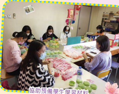
協助預備學生學習材料