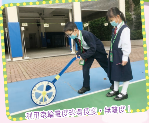
利用滾輪量度球場長度，無難度！