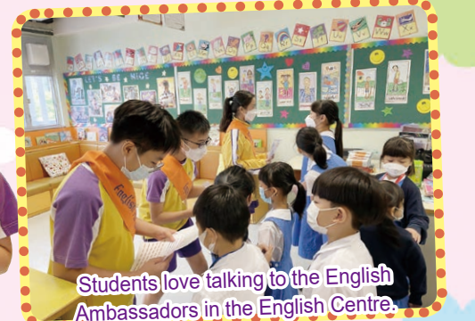
Students love talking to the English Ambassadors in the English Centre.