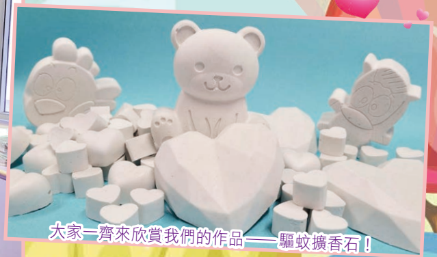
大家一齊來欣賞我們的作品——驅蚊擴香石！