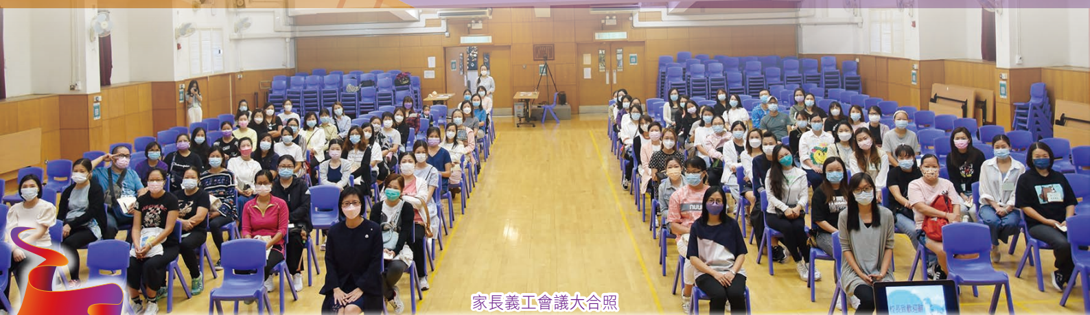
家長義工會議大合照