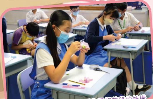
花兒「開」了！讓我深入了解花兒的結構