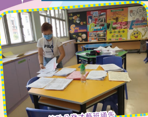
協助分發才藝班通告

本年度約有140名家長報名成為義工！感謝家長義工的鼎力支持，踴躍參與義工服務。在這段疫情反覆的時期，他們仍積極參與各類的服務，如：量度體溫、處理圖書館館務、製作校園佈置等。家長義工在參與服務的過程中，讓子女學會犧牲和服務的精神，促進子女的個人成長，成為子女的好榜樣！