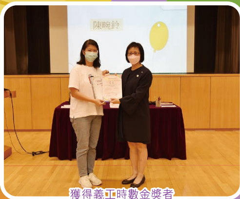
獲得義工時數金獎者