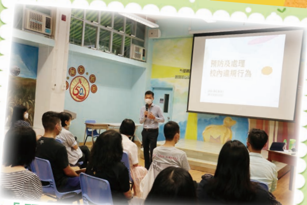
「預防及處理校內違規行為」講座