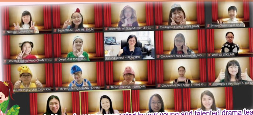
What a remarkable performance presented by our young and talented drama team!

The highlight of this school year's activity most definitely is the Ka Ling Motion Sensing Games! P.3 students got to be the first level to experience learning English through playing interactive motion sensing games in the covered playground. There were a range of whole-school activities like Phonics Fun, game booths and thematic activities for all P.1 to P.6 students to participate in too. Students had many opportunities to learn English in a fun and enjoyable way!