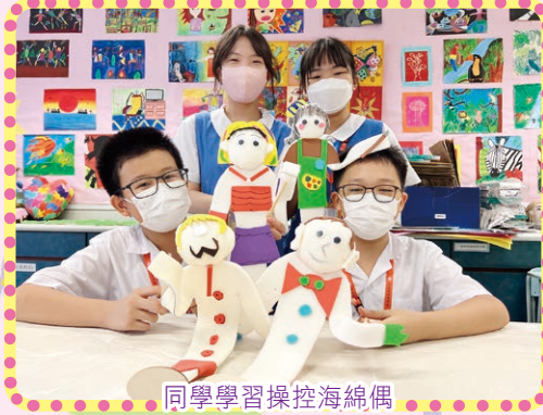
同學學習操控海綿偶