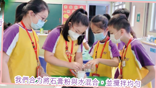
我們合力將石膏粉與水混合，並攪拌均勻