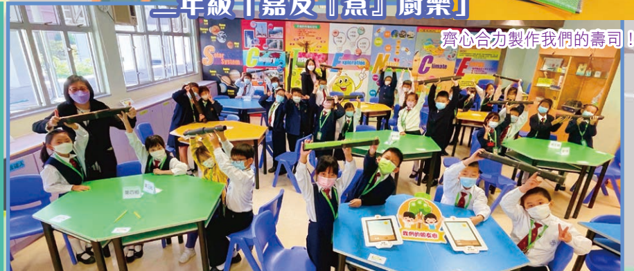
齊心合力製作我們的壽司！