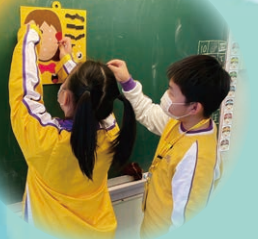
我們一起進行「情緒拼拼貼」遊戲