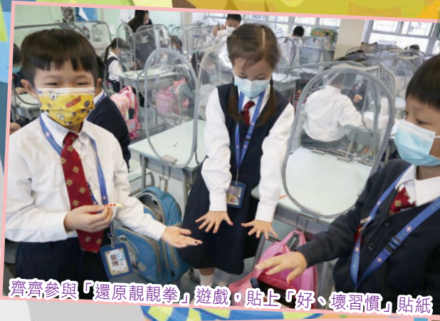
齊齊參與「還原靚靚拳」遊戲，貼上「好、壞習慣」貼紙