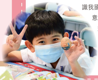
我會像爸媽愛護我一樣，愛惜我的「蛋寶寶」！