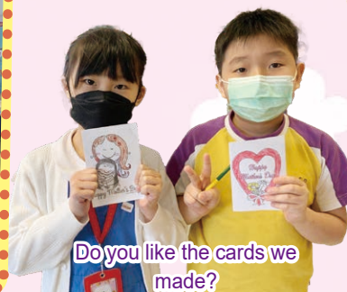
Do you like the cards we made?