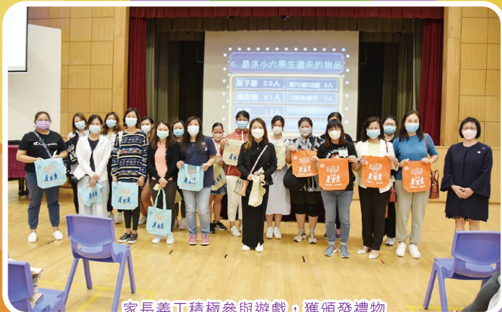
家長義工積極參與遊戲，獲頒發禮物