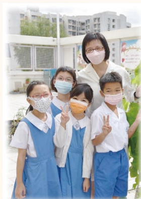
你看到嗎？孩子的笑臉啊！

我深信：孩子們的學習過程也像運動員的奮鬥歷程一樣。只要我們在學科上「有心」學習，便會朝着目標掌握學習學科知識的竅門和樂趣。只要相信自己「有心有力」，學習便會水到渠成。此外，