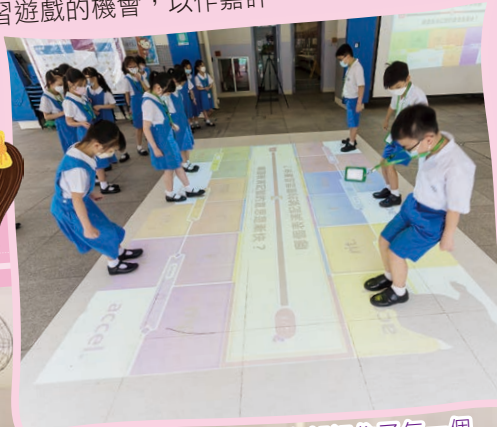
你跳跳，我唱唱，大家都記住了每一個「音樂記號」，真棒！！