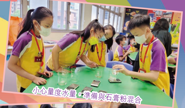
小心量度水量，準備與石膏粉混合