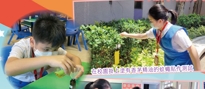
在校園掛上塗有香茅精油的蚊蠅貼作測試