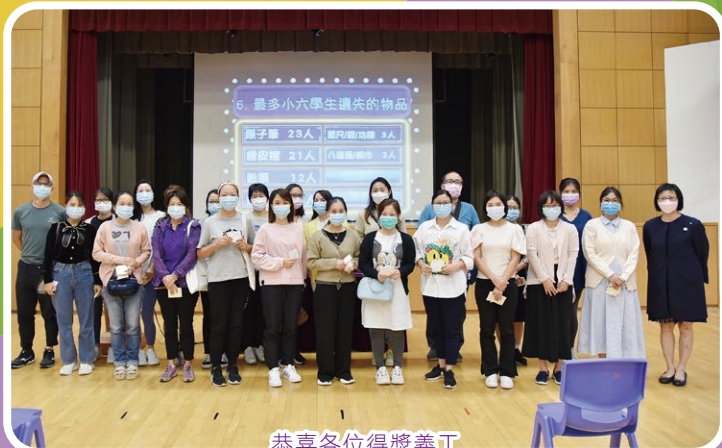
恭喜各位得獎義工