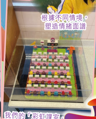
根據不同情境，塑造情緒面譜