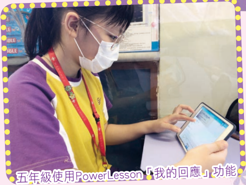
五年級使用PowerLesson「我的回應」功能