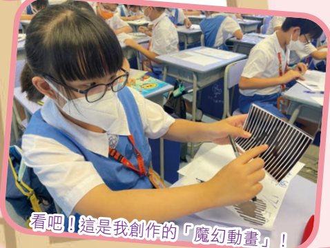
看吧！這是我創作的「魔幻動畫」！