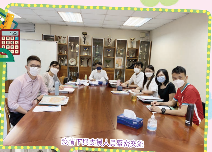
疫情下與支援人員緊密交流