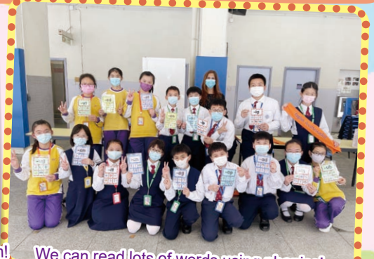
We can read lots of words using phonics!