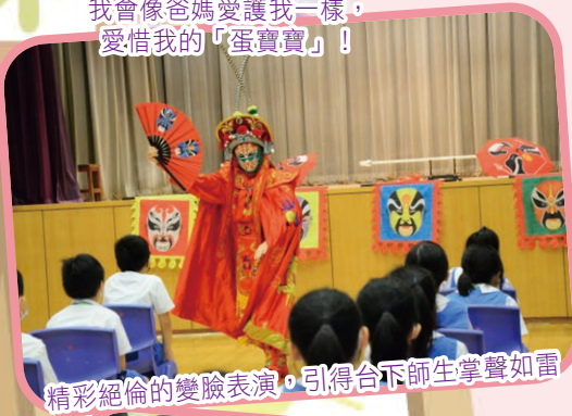
精彩絕倫的變臉表演，引得台下師生掌聲如雷