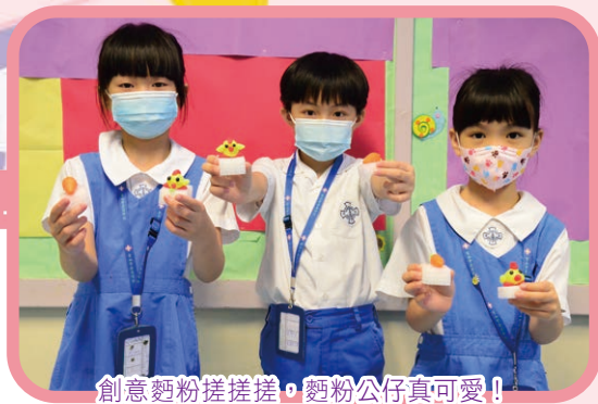
創意麪粉搓搓搓，麪粉公仔真可愛！

三天的學習活動以「反思課」作結，於老師的帶領下，學生一同回顧學習經歷，並作出反思。我們期望學生均能以耶穌基督為榜樣，成為一個懂得關愛生命、熱愛學習的人，長大後為社會作出貢獻。