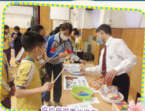
協助舉辦攤位遊戲