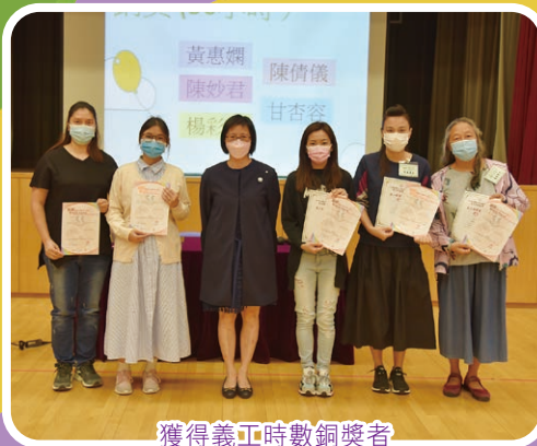
獲得義工時數銅獎者