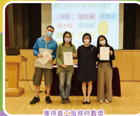
獲得義工服務時數獎