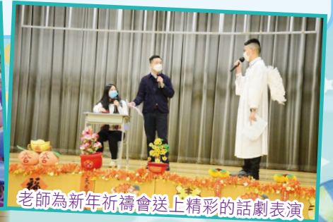
老師為新年祈禱會送上精彩的話劇表演