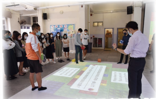
「學習使用科本的電子應用程式及體感遊戲裝置」工作坊