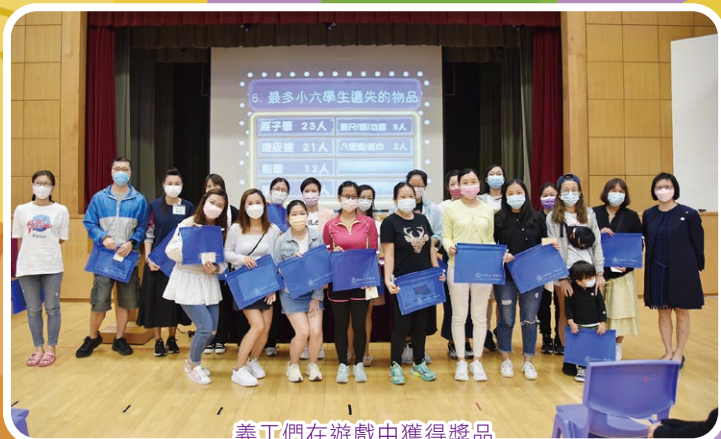
義工們在遊戲中獲得獎品