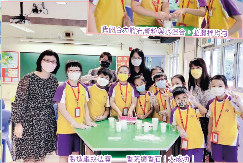
製造驅蚊法寶——香茅擴香石！太成功！