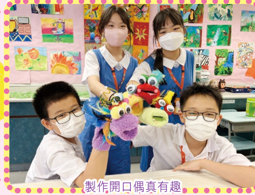
製作開口偶真有趣