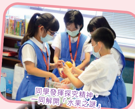
同學發揮探究精神，一同解開「水果之謎」