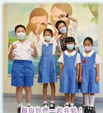
願與你們一起共勉！

我們更需要對天主有一份「信心」，相信天主會給予我們助佑。在學習初期，我們對學科學習會充滿濃厚的興趣。然而時間久了，我們就需要用「決心」來堅強自己的毅力和鬥志，令學習持之以恆，我們才不會輕易放棄學習的初心。在學習過程中，我們還需要專心一意，集中心力。因為「專心」就能專注所學，學科知識便會更融匯貫通，從而產生優良的學習效果。除了「專心」之外，「盡心」也是不可或缺的。當我們的學習漸入佳境時，我們便應竭盡心思，殫精竭慮，「盡心」盡力，才能學得更多，走得更遠。此時，我們再帶上一顆「上進心」，奮發向上，積極求進，必定能突破自己的界限，得到更大的進步。再者，在學習過程中，我們要時刻懷着「希望心」，抱着希望的心態來面對人和事，以激勵自我，勇於學習；最後，在整個學