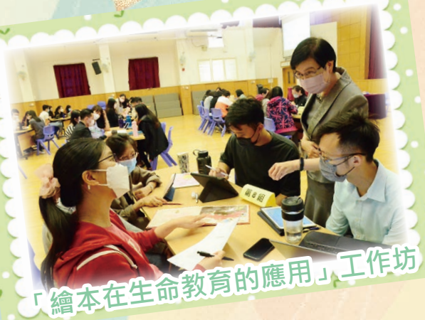
「繪本在生命教育的應用」工作坊