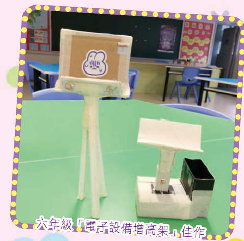
六年級「電子設備增高架」佳作