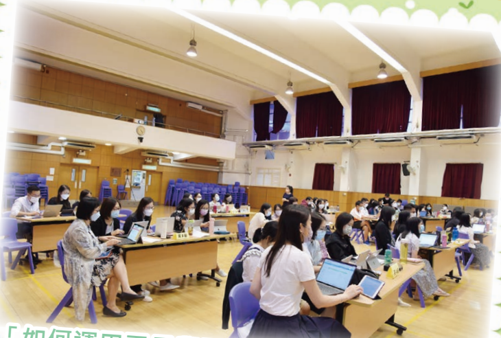
「如何運用電子學習促進自主學習」工作坊