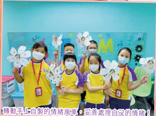
轉動手上自製的情緒風車，妥善處理自己的情緒！