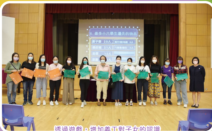
透過遊戲，增加義工對子女的认识