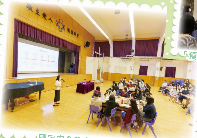
國家安全教育到校教師工作坊