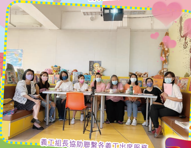
義工組長協助聯繫各義工出席服務