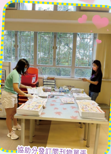
協助分發訂閱刊物單張